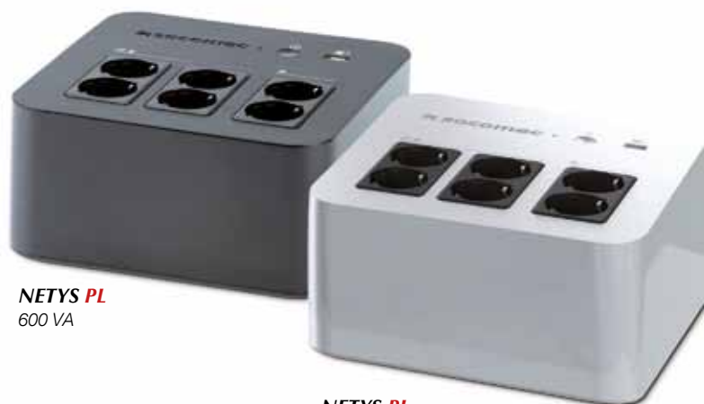
NETYS PL 600 VA